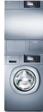
Modèle présenté: WSI970 + DSI970CO Montage en colonne