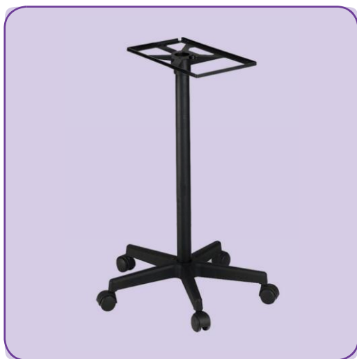
4 roues pivotantes (dont 2 roues avec freins)