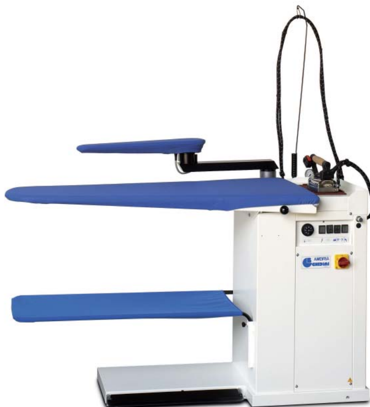
Table universelle aspirante et chauffante, avec chaudière et aspirateur