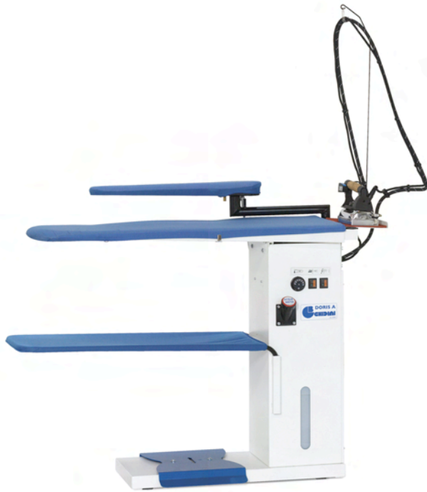
jeannette en option