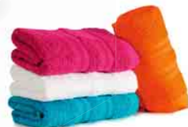
DD 10 EC